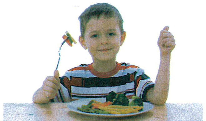
Dječji vrtić „Katarina Frankopan“ jesen-zima